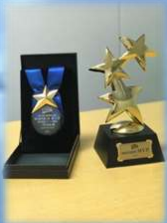
メダル・トロフィー