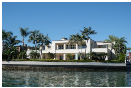
ボートからウォーターフロントの高級住宅を視察