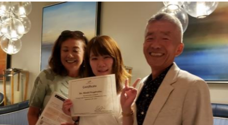
修了パーティ。涙あり、笑いあり。感動のフィナーレ?