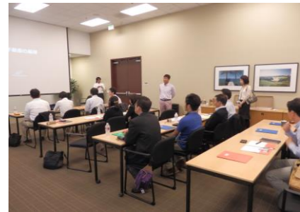
クラストレーニングで米国と日本の違いを学ぶ