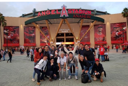
It's 翔 Time! 今年も観戦の予定です♪