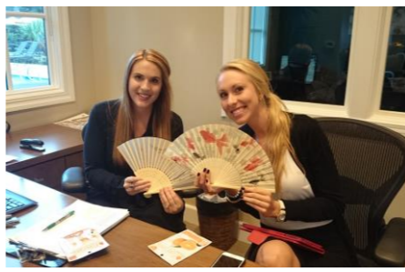
リーシング・オフィスのスタッフと情報交換