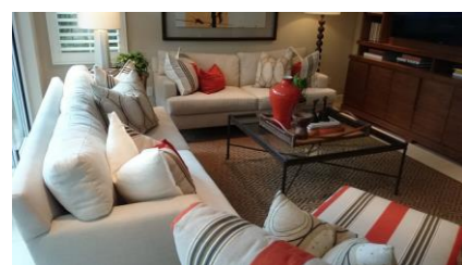
日本でも定着した「ホームステージング」