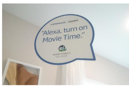
「Alexa、映画の時間だよ」スマートハウスの普及