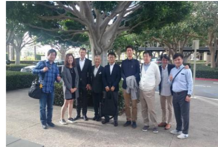
エスクロー・オフィスにて米国流の取引を学ぶ