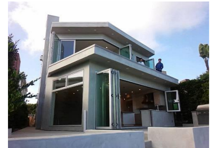
毎年変化する「新築住宅のトレンド」