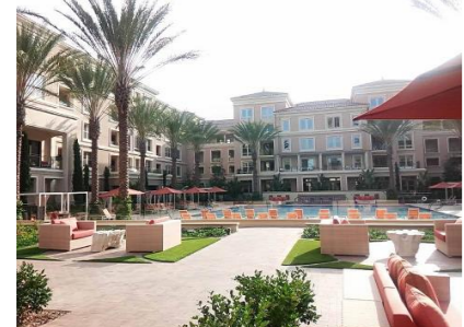
ラグジュアリーな賃貸物件の視察