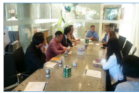
不動産会社ベンチマークとディスカッション